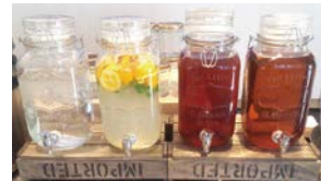
日本ガラスびん協会

2016年11月16日(水)～12月15日(木)で期間限定開催しましたカフェ企画。おかげさまで盛況のうちに幕を閉じる事ができました。「びんむすめ」を入口に、看板メニューのJARボトルスイーツやサラダは見た目にも楽しく、インスタグラムといったSNSに写真が投稿されるなど、話題拡散の一助になったようです。ささやかながら「ガラスびんの魅力を体験できる場づくり」をお客様へ提供できたのではないかと考えております。今後も、日本ガラスびん協会の広報企画にご期待ください！