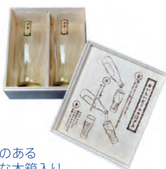
高級感のある 本格的な木箱入り。