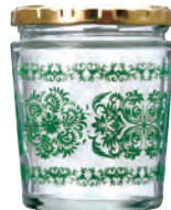
380-ZB ブラック/グリーン