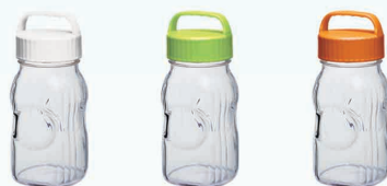
たっぷり楽しめる 1.5L サイズ