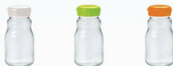
気軽につくれる 930ml サイズ