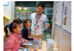
▲『万華鏡』の中 ◀ PETボトルの『万華鏡』