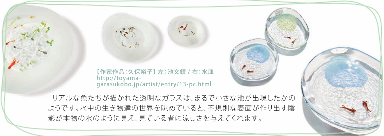
【作家作品：久保裕子】左：池文鎮 / 右：水皿 http://toyama-garasukobo.jp/artist/entry/13-pc.html

毎年夏になるとその暑さに悩まされますが、今年は特に電力不足等の影響で、暑さをしのぐのがいっそう厳しくなりそうです。いかに暑い夏を乗り切るか様々な対策がなされている中、五感を通して涼しさを体感できる透明なガラスに着目してみました。