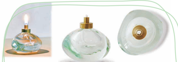
【EZRA GLASS STUDIO】キャンドルランプ クリアストーン http://www.ezraglass.com/products/index.html

艶やかで透明な氷を思わせるフォルムは、石ころをイメージして作られています。ころころとして思わず手に持ちたくなる形です。蛍光灯の廃材を再利用しているため、ガラスは薄緑色をしています。