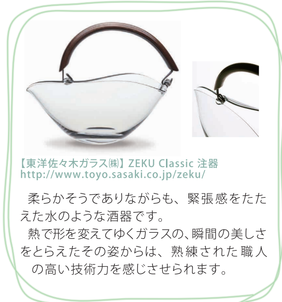
【東洋佐々木ガラス(株)】ZEKU Classic 注器 http://www.toyo.sasaki.co.jp/zeku/

一見シンプルな透明のグラスは、光が当たった時、その影に思いもよらない様々な模様を映し出します。繊細な厚みの変化で描かれた影の模様は、光をとおしてゆらめく水中の波紋のようでもあり、とても情緒的です。